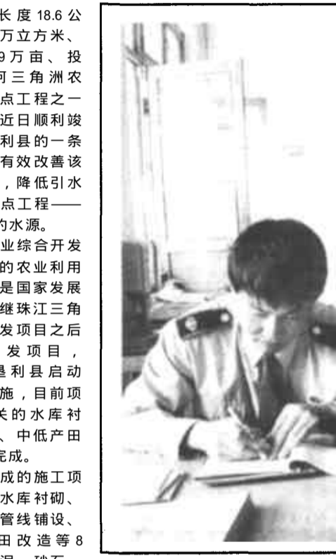
为了加大地租征收力度，垦利县地税局胜利分局工作人员深入农村征收车船使用税。

河口讯 近几年来，河口区河口街道依托芦苇资源，从本地实际出发，大胆实践，勇于创新，通过“加强三个建设，完善一个市场”，走出了一条以发展芦苇产业促农民增收、财政增收的路子。河口街道成为远近闻名的“芦苇之乡”。 龙头企业是产业发展的关键。为增加芦苇的产出效益，提高芦苇的市面市场竞争力，该街道始终把培育龙头企业作为推进产业化的切入点，通过