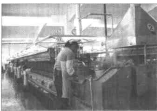
图为阳光丝业自动缫生产线