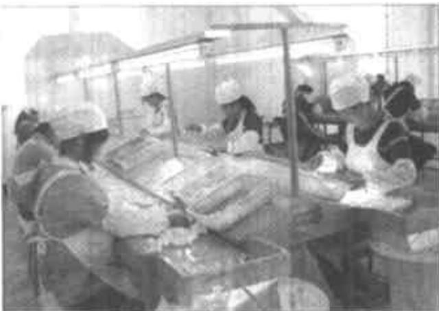
图为阳光丝业选别流水线

针对我市龙头企业建设滞后的现状，记得一位市领导近年来曾经不止一次地说过这样一句严肃的话：必须牢固树立抓龙头就是抓农业，抓农业必须首先抓龙头，扶持龙头就是扶持农业、扶持农民的观念，横下一条心，全力抓好龙头企业建设。不抓